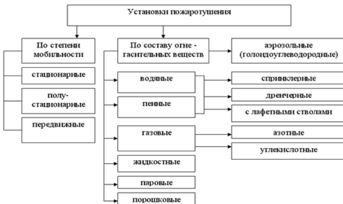
Рисунок – 2.2 Установки пожаротушения

Основу первичных средств пожаротушения на рабочем месте слесаря-ремонтника в ремонтно-механическом цехе составляют огнетушители, которые классифицируют по типу огнегасительного вещества