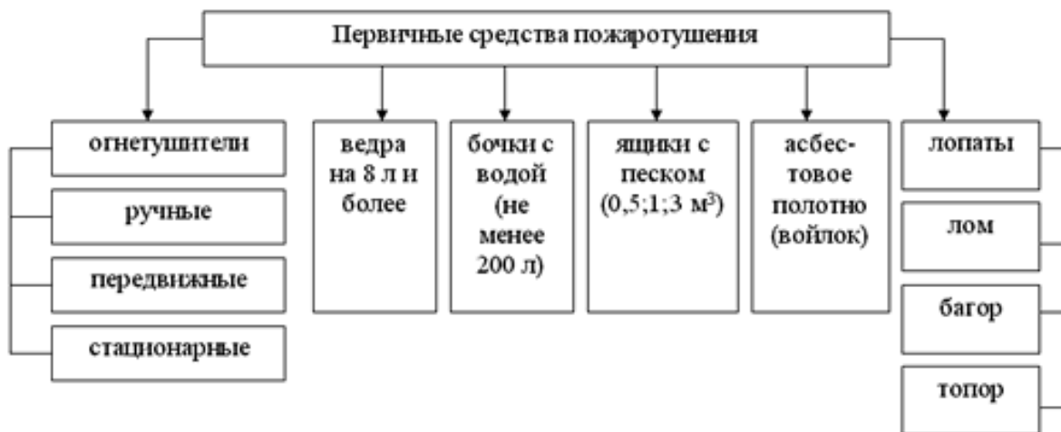
Рисунок 2.3 Первичные средства пожаротушения

В цехе нужно использовать первичные средства пожаротушения, которые являются обязательными для комплектования противопожарных щитов (рисунок 2.3).