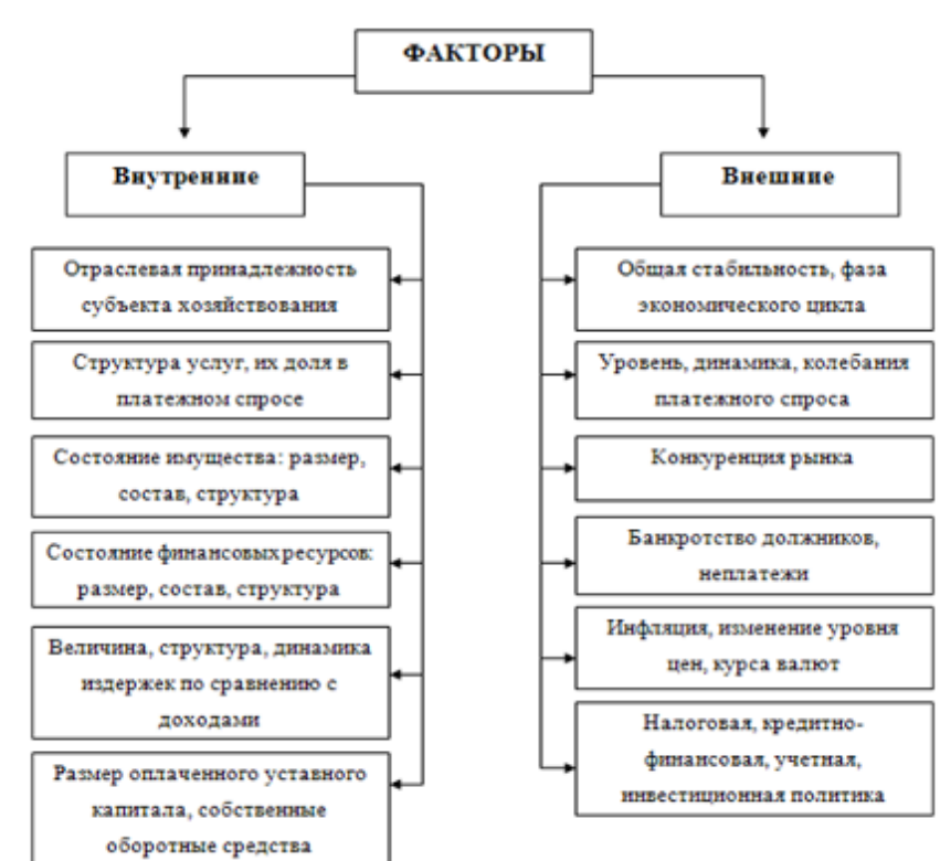
Рисунок 1 - Факторы, влияющие на финансовую устойчивость организации

Факторы, влияющие на финансовую устойчивость организации, приведены на рисунке 1.