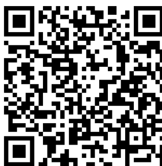
Рис. 7.1 Ответы на вопросы журналистов по итогам рабочего визита в КНР

Задание 2. Ознакомьтесь со стенограммой пресс-конференции Президента РФ В. В. Путина. Какие СМИ были аккредитованы? Проанализируйте соотношение общероссийских и региональных СМИ. Составьте список актуальных для СМИ вопросов, которые обсуждались на пресс-конференции. Проанализируйте их тематику. Вопросы какого плана преобладали (социальные, политические, экономические)?